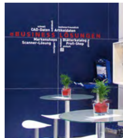
Riegler eBusiness Cloud mit Infos zu den vielfältigen eBusiness Lösungen von Riegler