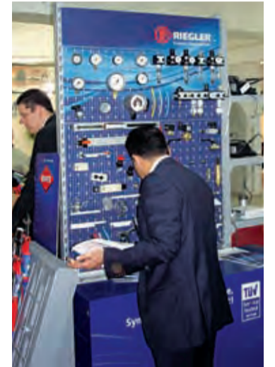
Mobiler Messestand „Riegler Mobil“ im Einsatz auf der Messe SIEL in Tunis.