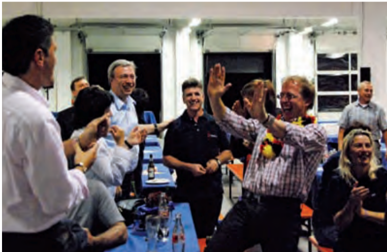
Tor für Deutschland – auch die portugiesischen Mitarbeiter (Mitte) jubeln verhalten mit.

Firmenfeier mit 200 Gästen und einem Sieg der deutschen Nationalelf gegen Portugal.