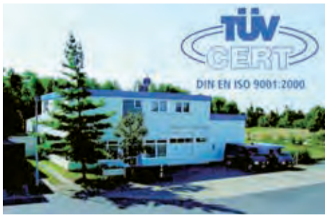
Qualität aus Hannover: Fey Druckluft.

Fey Druckluft steht für perfekten Service in Hannover – und das nicht nur zur Messe.