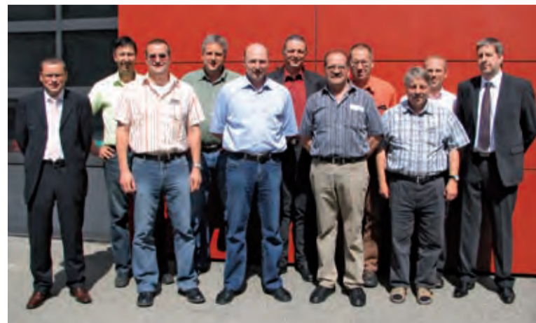
Zufriedene Gäste: Händlerpartner bei einer Vertriebsschulung.

Je nach Bedarf stimmen unsere kompetenten Referenten die Schulungsinhalte dabei gerne auf individuelle Teilnehmergruppen ab.