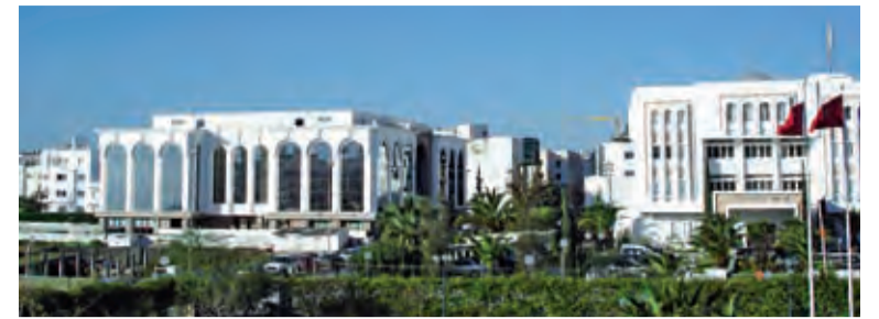
Tunis: Moderne Hauptstadt und Tor nach Europa.

Vertriebskooperation mit EP Technology in Tunis