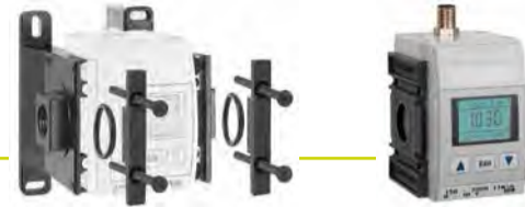
Artikel Nr. KDDM-220, Artikel Nr. KDDM-250

eine PC-Analysesoftware zur Verfü- gung. Das Durchflussmessgerät lässt sich zudem einfach und schnell an eine FUTURA-Wartungseinheit adap- tieren. Wahlweise kann es mit einer entsprechenden Wandkonsole in ein bestehendes Rohrleitungssystem integriert werden.