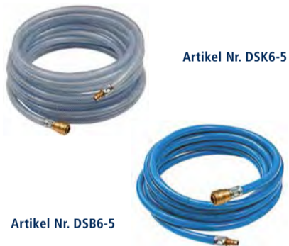
Artikel Nr. DSK6-5

Die Auswahl unserer konfektionierten Schläuche ist vielseitig und höchst variabel. Egal ob mit Messing-Schnell- verschlusskupplung NW 7,2 oder mit Druckknopf-Sicherheitskupplung NW 7,4 ausgestattet, sind diese Schlauch- sets in unterschiedlichen Längen von 5 bis 25 m erhältlich. Das Angebot reicht