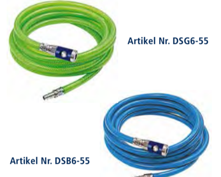
Artikel Nr. DSG6-55

vom Standardschlauch über einen besonders weichen Soft-Werkstatt- schlauch bis hin zum leuchtgrünen Sicherheitschlauch. Die hochwertige Hülsenverpressung von Kupplungen und Stecknippel weist keine scharfen Kanten auf und gewährleistet eine sichere, dichte Verbindung.