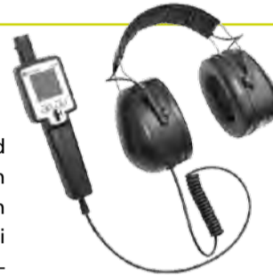
Artikel Nr. LS 100

Druckluft-, Gas- und Vakuumanlagen, auch aus mehreren Metern Entfernung und bei lauten Nebengeräu- schen. Somit können bei laufendem Betrieb exakte Messungen durch-